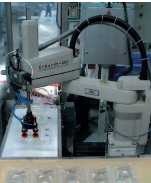
Greifer zum Ansaugen von Infusionsbeutel (Inhalt 200 ml) für eine Verpackungsanlage

Das Verpacken von Lebensmitteln und Gütern des täglichen Gebrauchs gehört mit Sicherheit zu den anspruchsvollsten Herausforderungen in der Automatisierungstechnik. Die Spezialisten von Erhardt + Abt verfügen auf diesem Gebiet über ein unschlagbares Know-how und fundierte praxisorientierte Erfahrung aus annähernd 250 erfolgreich realisierten Projekten.